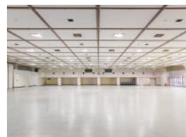
第1ファッション展示場