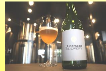
ノンアルコールドリンク alcomock